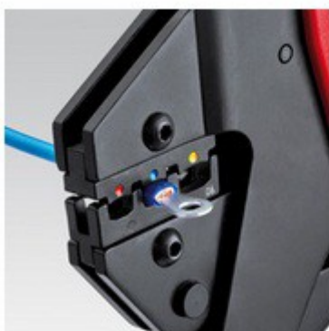
97 43 200 с приставка за кримпване 97 49 06 за изолирани кабелни обувки, конектори и челни конектори

С възможността да се пресоват почти всички актуални кримп конектори в един инструмент с най-съвременна технология на кримпване, системните клещи за кримпване решават почти всички задачи в мобилната и стационарна технология на кримпване и за стандартно кримпване са идеалният професионален инструмент.