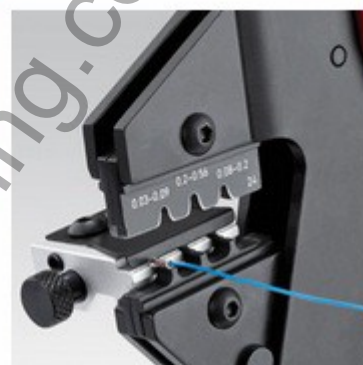
97 43 200 с приставка за кримпване 97 49 24 и приспособление за позициониране 97 49 93 за D-Sub-конектори